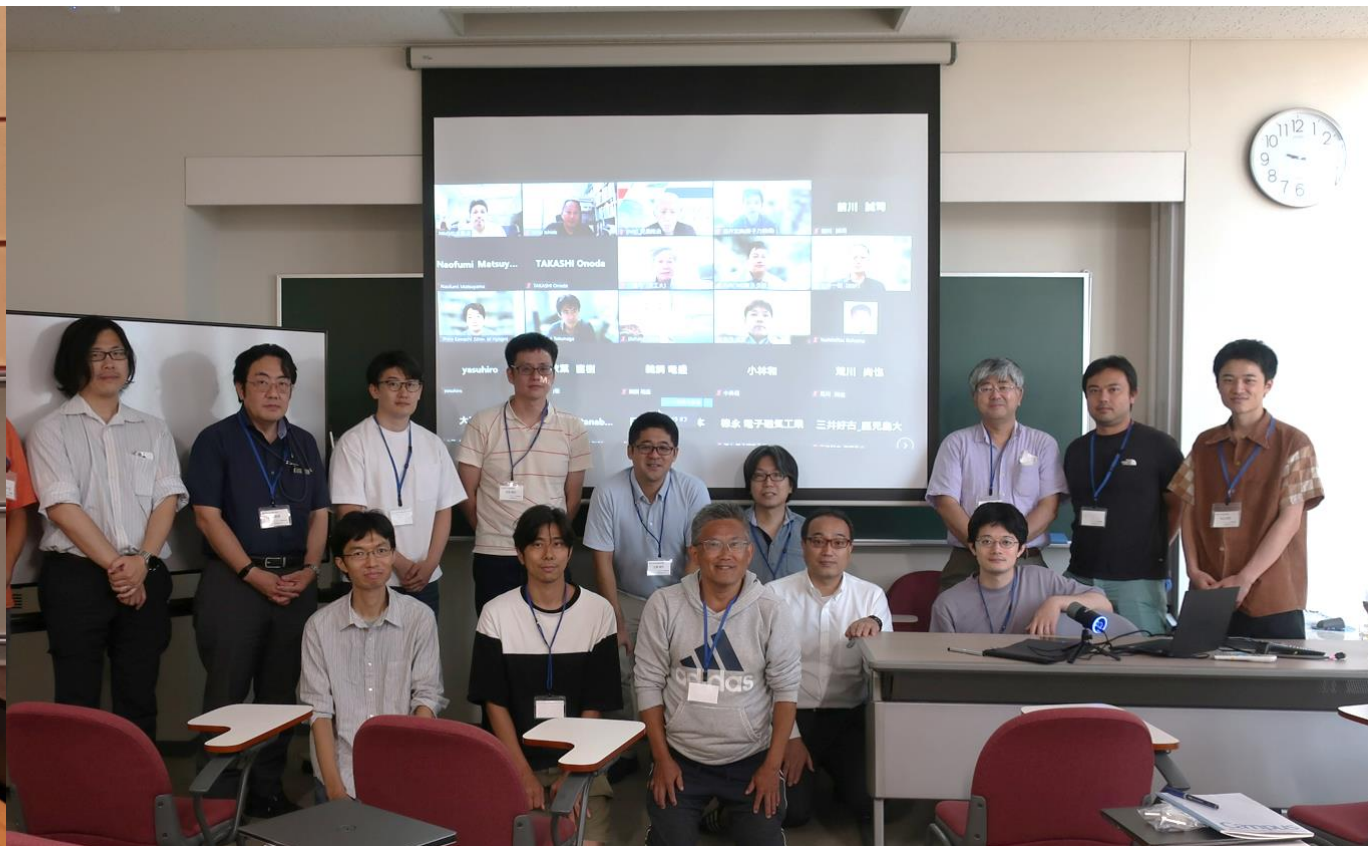
ロングパルス磁場についての研究会を開催しました。